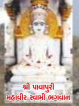
શ્રી પાવાપુરી મહાવીર સ્વામી ભરાવાન