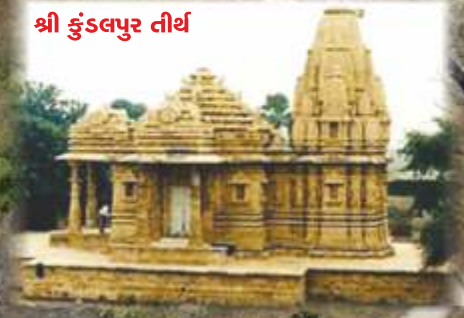
શ્રી કુંડલાપુર તીર્થ