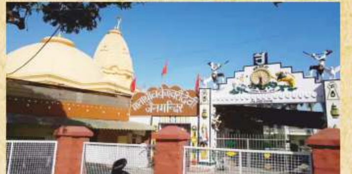
ચક્રેશ્વરી દેવી જેન મંદિર સરહિંદ (અતાવલી)