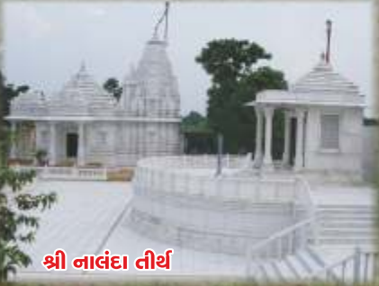
શ્રી નાલંદા તીર્થ