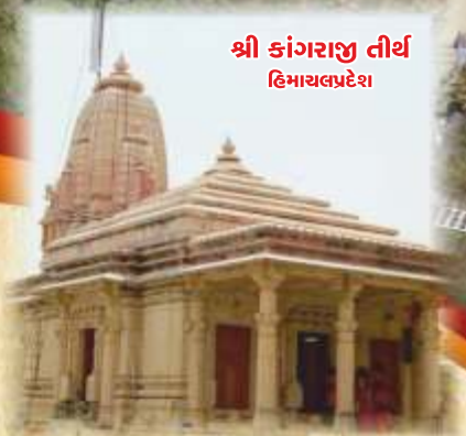
શ્રી કાંગરાજી તીર્થ હિમાચલપ્રદેશ