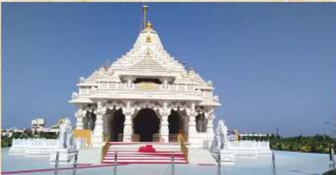
મહીલક્ષ્મી જેન મંદિર, લુધિયાણા