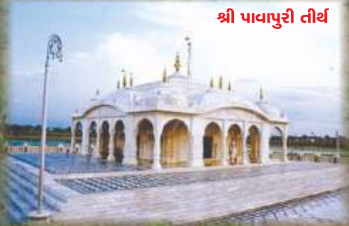
શ્રી પાવાપુરી તીર્થ